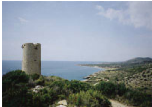
Torre de Peñíscola