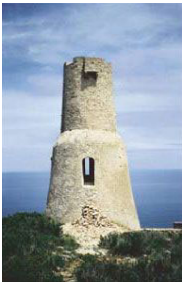
Torre de Dénia

Quan es donava la veu d'alarma, la població tocava les campanes de l'església per avisar la resta dels veïns, que portaven les coses de valor a la torre, i duïen els aliments necessaris per resistir el possible setge i preparar la defensa.