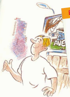
El tabac i la publicitat