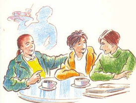
El tabac i la pressió social