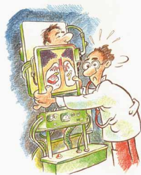
El tabac i la salut